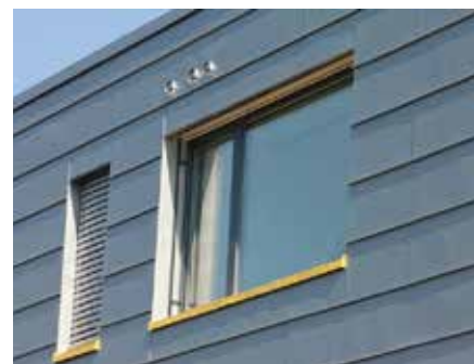
Fasáda rekonstruované budovy B (Údolní 33)

Pro rorýse je typická pevná vazba na hnízdiště. Kde jednou úspěšně vyhnízdí, tam se opakovaně vrací. Pokud o hnízdní dutinu přijde, trvá mu i několik let, než si najde novou. Probíhají-li navíc rekonstrukce budov, využívaných těmito ptáky k hnízdění, v jejich hnízdním období (od 20. dubna do 10. srpna) a jsou-li práce situovány do těsné blízkosti ventilačních průduchů, může dojít k významnému rušení právě probíhajícího hnízdění. V horších případech dojde i k úplnému zamezení přístupu do dutin ve střešních konstrukcích nebo do samotných ventilačních průduchů, což má často za následek usmrcení nevzletných mláďat nebo i dospělých jedinců (samice sedící na hnízdech). I proto je v ČR Rorýs obecný zvláště chráněný jako ohrožený druh.